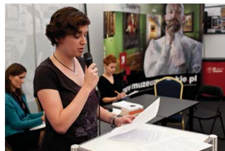
Piątkowe czytanie w ramach akcji „Twoje 10 minut”

O g.11. wortal literacki granice.pl zaprasza do sali 1 na rozstrzygnięcie konkursu na najlepszą książkę jesieni . Godzinę później w tym samym miejscu granice.pl i wyd. MG zapraszają na ogłoszenie wyników konkursu na najlepszy literacki blog roku . Pomiędzy g.13 a 16 w sali 2 zakończy się konkurs portalu CzasDzieci „ Czytać tak-ale jak? ”. Dwa konkursy rozstrzygnie w południe Podkarpacki Instytut Książki i Marketingu w Rzeszowie (B67): „ Słowem malowane ” oraz „ Targowość ”. O g.15 w sali 3 odbędzie się finał akcji konkursowej „ Twoje 10 minut ”, którą przygotowały fundacja Znaczy się i Strefa Wolnego Czytania. W jej ramach pierwszego i drugiego dnia Targów 10 młodych autorów czytało przed jury i reprezentantami wydawców swoje teksty, pisane dotychczas do szuflady. Zaś dzięki współpracy Strefy i księgarni internetowej Virtualo finaliści konkursu będą mieli możliwość publikacji książki w formie e-booka.