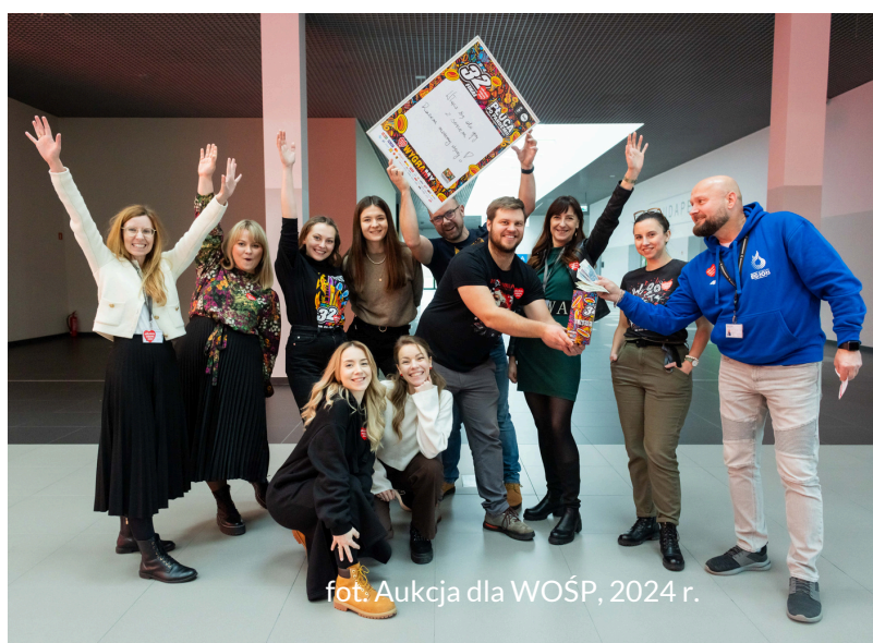
fot. Aukcja dla WOŚP, 2024 r.

Tradycją stały się spotkania z wolontariuszami Krakowskiego Sztabu WOŚP podczas wydarzeń organizowanych przez firmę. Przykładem mogą być Międzynarodowe Targi Książki w Krakowie®, podczas których wydawcy chętnie przekazują książki na aukcję.