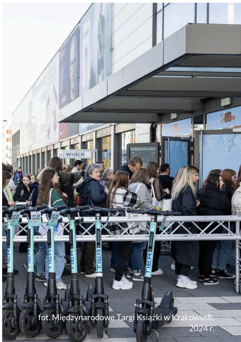
fot. Międzynarodowe Targi Książki w Krakowie®, 2024 r.