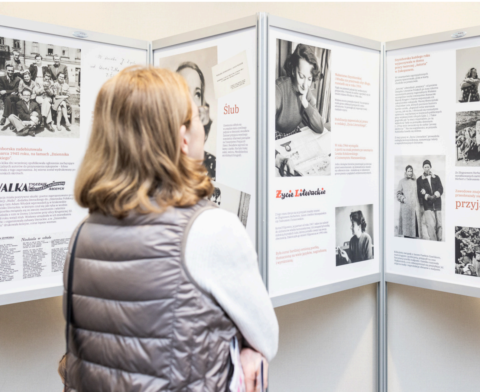
Wystawa „Sto lat! Wisława Szymborska” podczas 26. Międzynarodowych Targów Książki w Krakowie®, 2023 r.