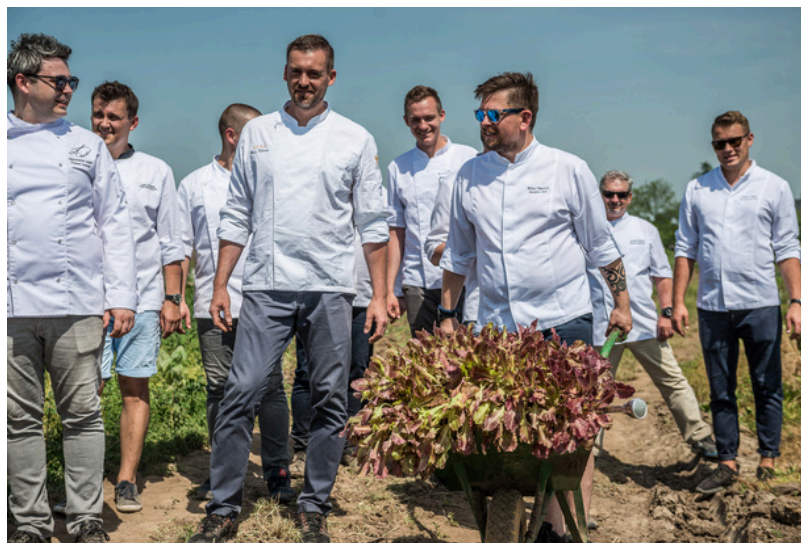
fot. Sadzenie głąbika krakowskiego przez szefów kuchni, 2019 r.