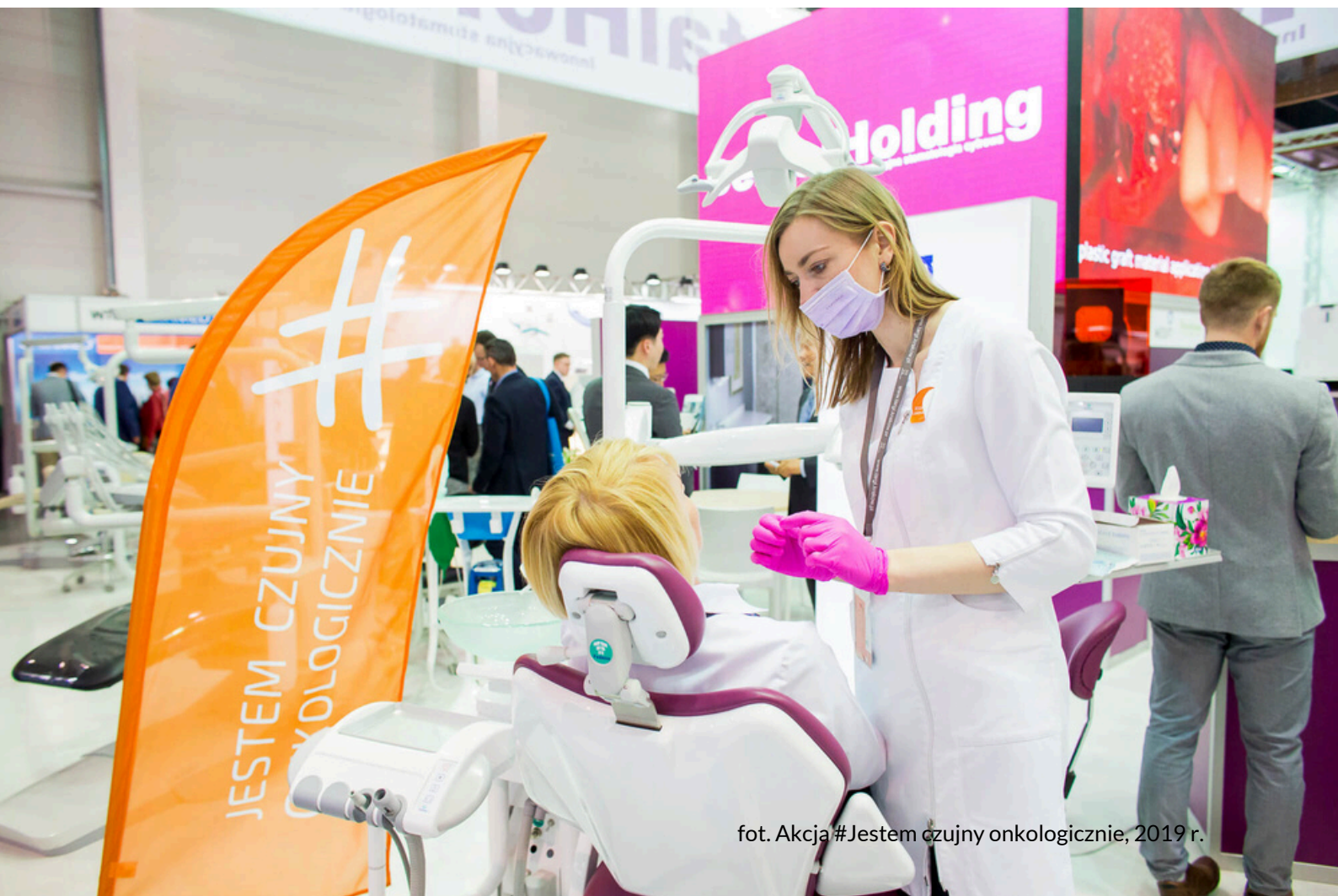
fot. Akcja #Jestem czujny onkologicznie, 2019 r.

W 2019 roku, podczas Międzynarodowych Targów Stomatologicznych KRAKDENT®, wspólnie z Fundacją „Z uśmiechem przez życie”, Zakładem Stomatologii Zintegrowanej oraz Zakładem Periodontologii i Klinicznej Patologii Jamy Ustnej w Instytucie Stomatologii Uniwersytetu Jagiellońskiego Collegium Medicum, przeprowadziliśmy akcję „Jestem czujny onkologicznie”. Na stoiskach firm uczestniczących w akcji odbywały się pokazowe badania przesiewowe w kierunku wykrywania nowotworów jamy ustnej. Stomatolodzy mogli dowiedzieć się, jak rozpoznawać objawy wskazujące na ryzyko nowotworu podczas standardowego badania jamy ustnej.