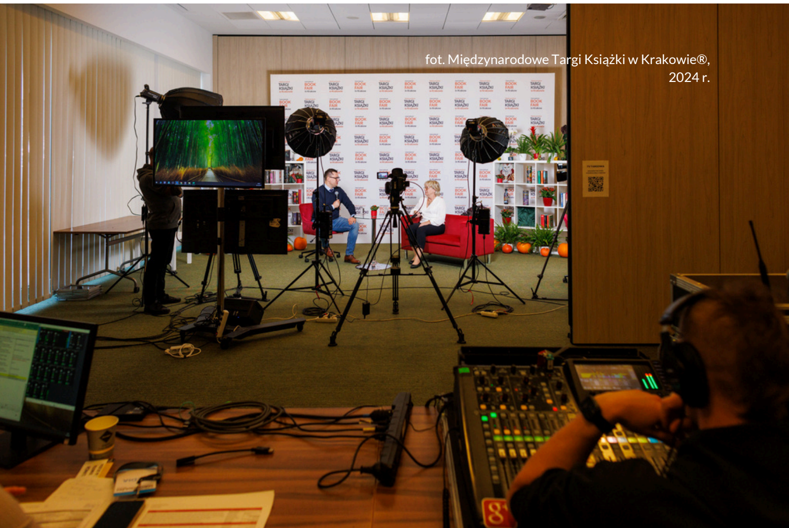
fot. Międzynarodowe Targi Książki w Krakowie®, 2024 r.