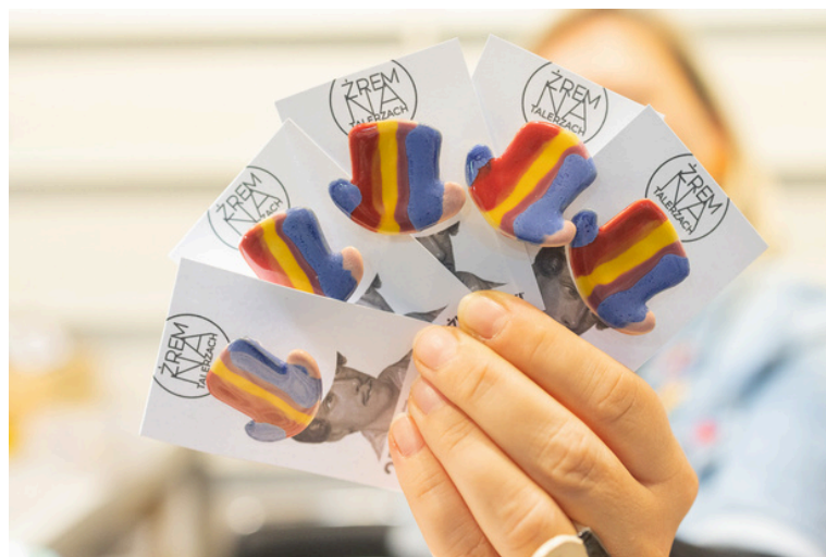
fot. Przypinki cyliner Juliusza Słowackiego, Międzynarodowe Targi Książki w Krakowie, Żrem na Talarzach, 2022 r.