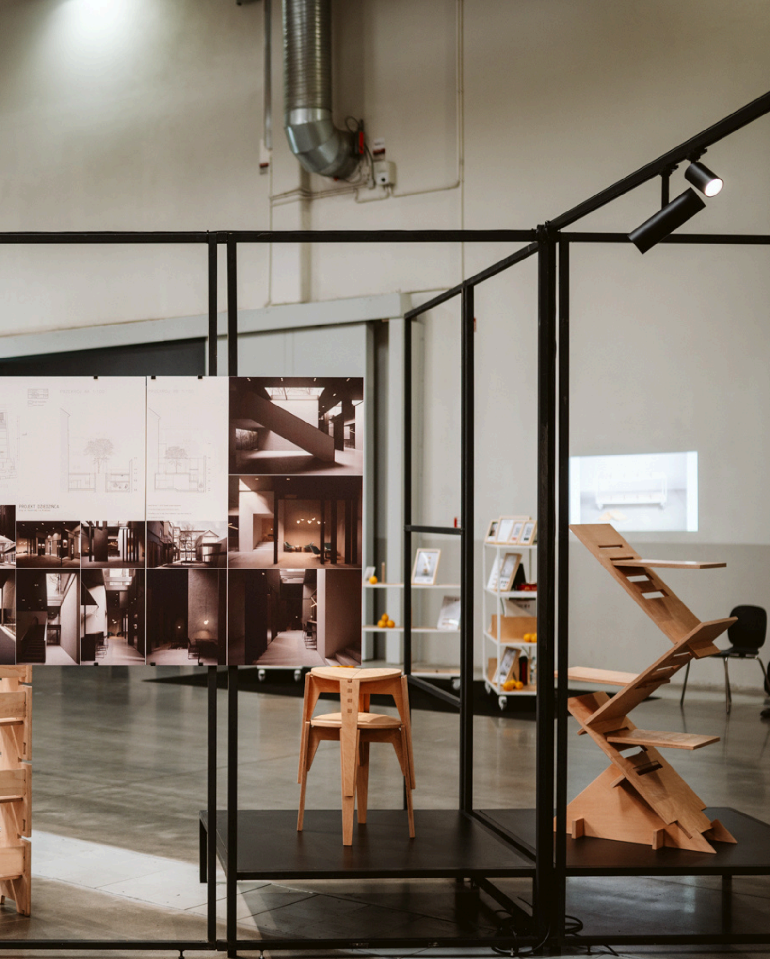
foto. Międzynarodowe Targi Architektury KIAF w Krakowie, 2024 r.