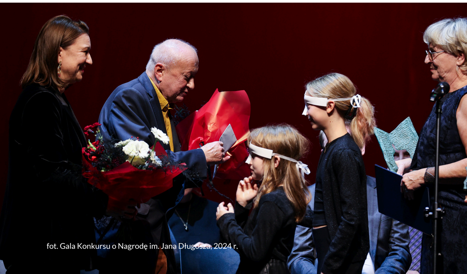
fot. Gala Konkursu o Nagrodę im. Jana Długosza, 2024 r.

w Krakowie® jest promocja książki popularnonaukowej z dziedziny szeroko rozumianej humanistyki, a tym samym aktywizowanie i motywowanie obecnych na polskim rynku wydawnictw do publikowania dokonań polskich naukowców i badaczy. Przedstawiane do Nagrody dzieła dostarczają gruntownej wiedzy i stanowią bogaty materiał do przemyśleń, stając się nie tylko lekturą, ale także przedmiotem studiów. Promowane w Konkursie publikacje utrwalają także wizerunek Krakowa i Małopolski jako regionu, który od wieków wyznaczał kierunki rozwoju polskiej myśli, nadawał tempo zachodzącym zmianom oraz wpływał na kształtowanie się tożsamości narodowej Polaków. Nad poprawnością prac w trakcie przygotowań do Konkursu czuwa Jury, w skład którego wchodzi wybitni przedstawiciele polskiego środowiska naukowego.