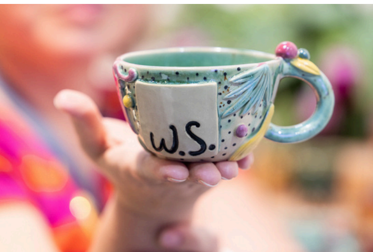
fot. Filiżanka Wisława Szymborska, Międzynarodowe Targi Książki w Krakowie, Żrem na Talarzach, 2023 r.

Chętnie wspieramy i promujemy lokalnych rzemieślników. Przykładem może być współpraca z firmą Żrem na Talerzach – pracownią ceramiki i biżuterii, której wyroby cechują się niepowtarzalnym stylem i wysoką jakością. Zamawiamy od nich unikatowe upominki dla naszych klientów, dzięki czemu możemy nie tylko dostarczać wyjątkowe prezenty, ale także wspierać rozwój lokalnego rzemiosła i promować rękodzieło. Tego rodzaju partnerstwa pomagają budować trwałe relacje z artystami i przyczyniają się do ożywienia lokalnej gospodarki, jednocześnie dając naszym klientom możliwość doświadczenia autentycznego piękna kultury rękodzielniczej.