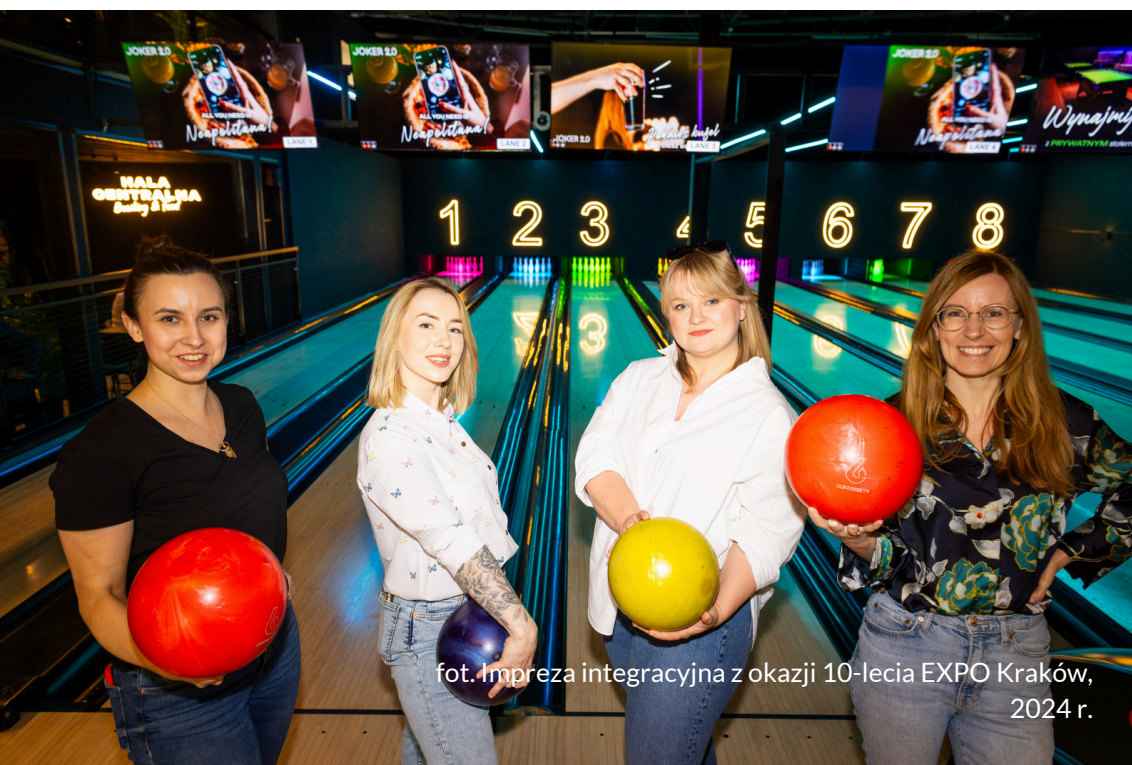
fot. Impreza integracyjna z okazji 10-lecia EXPO Kraków, 2024 r.

Naszym celem jest budowanie wiarygodności poprzez transparentną komunikację i konsekwentne przestrzeganie naszych zasad i wartości.