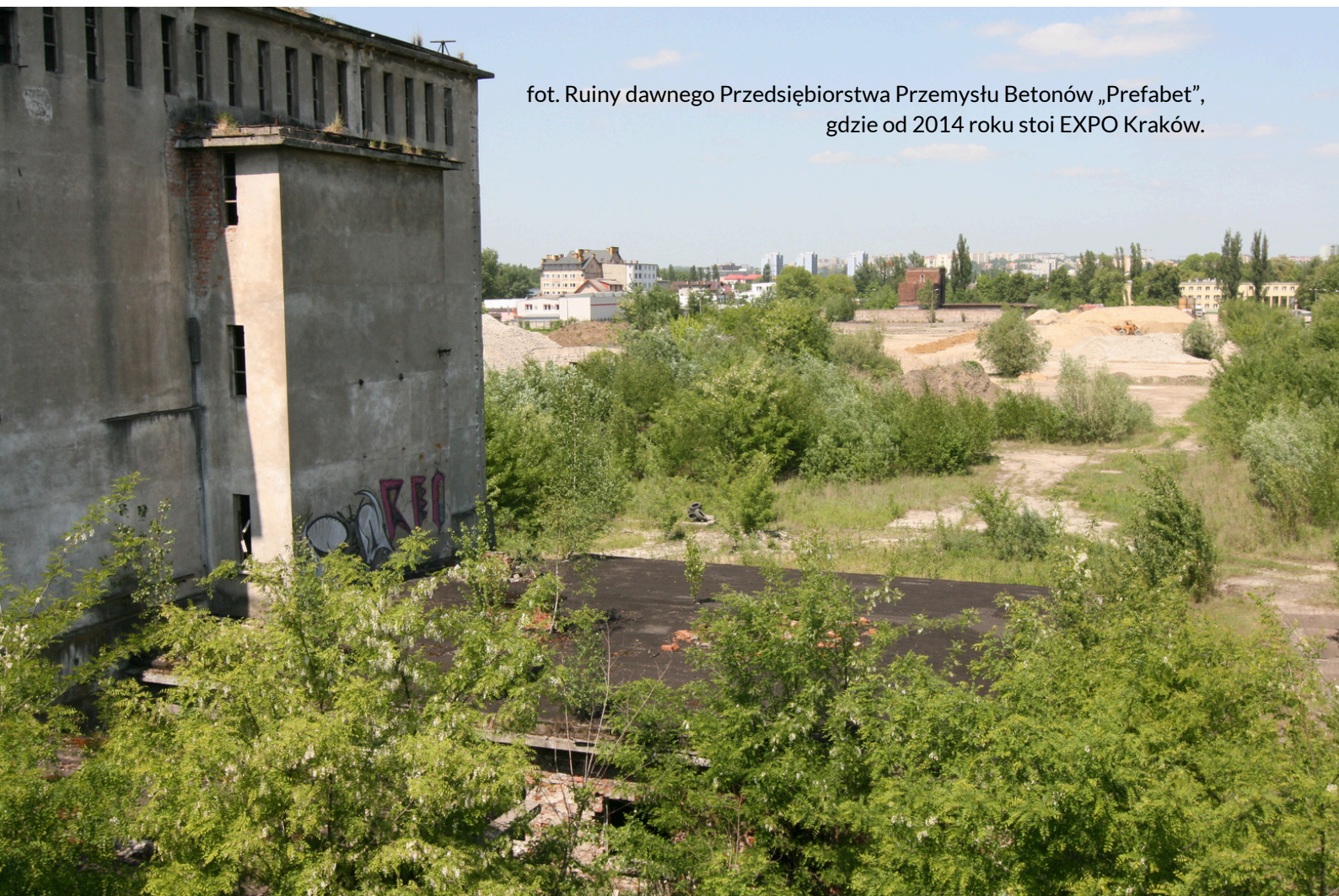
fot. Ruiny dawnego Przedsiębiorstwa Przemysłu Betonów „Prefabet”, gdzie od 2014 roku stoi EXPO Kraków.