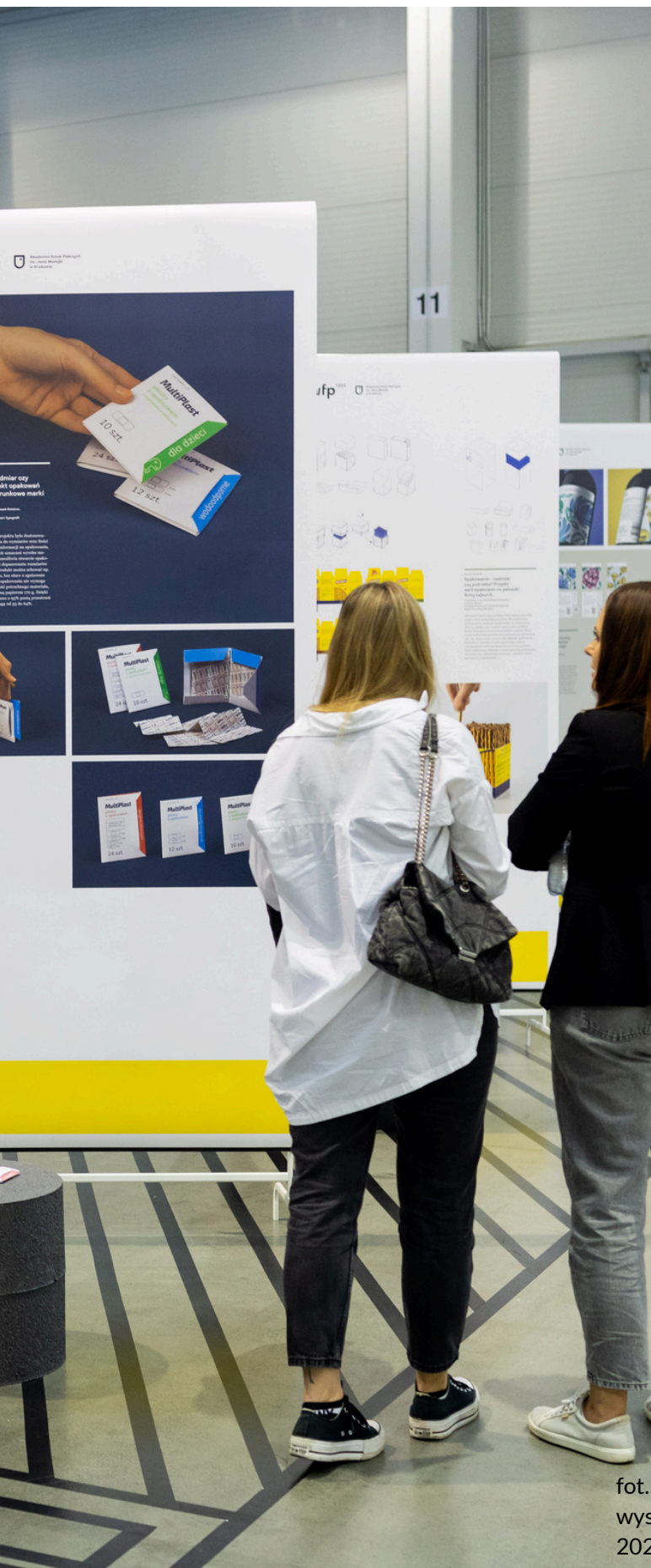
fot. Międzynarodowe Targi Opakowań Packaging Innovations, wystawa ASP w Krakowie Wydział Form Przemysłowych, 2024 r.