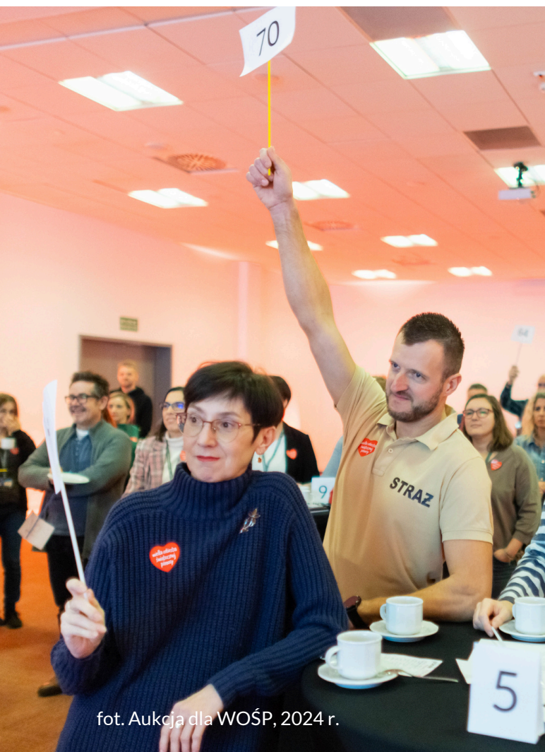
fot. Aukcja dla WOŚP, 2024 r.

Serniki, mazurki, chałki, tarty, konfitury, pasty kanapkowe, owsianki oraz wszelkiego rodzaju usługi, takie jak profesjonalna sesja zdjęciowa, bukiet kwiatów na wybraną okazję, szkolenie z budowy drzewa genealogicznego czy zestaw książek motywacyjnych – to zaledwie kilka przykładów dóbr zgłoszonych na wewnętrzną aukcję organizowaną przez pracowników Targów w Krakowie dla pracowników i partnerów firmy. Celem było wsparcie Wielkiej Orkiestry Świątecznej Pomocy i Krakowskiego Sztabu WOŚP przy Urzędzie Miasta Krakowa. W akcję włączyli się również partnerzy firmy.