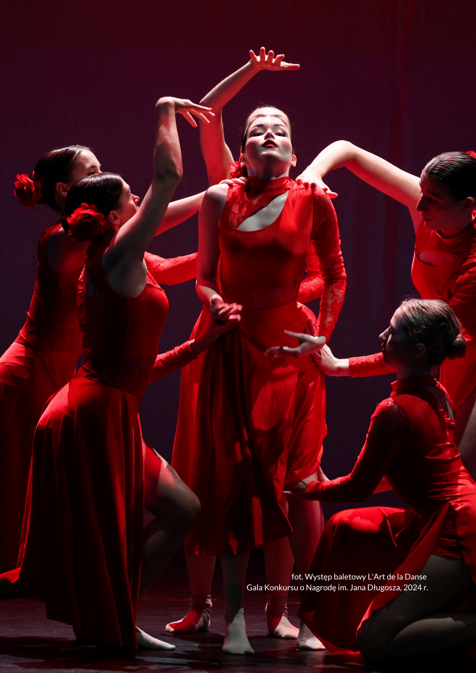
fot. Występ baletowy L'Art de la Danse Gala Konkursu o Nagrodę im. Jana Długosza, 2024 r.