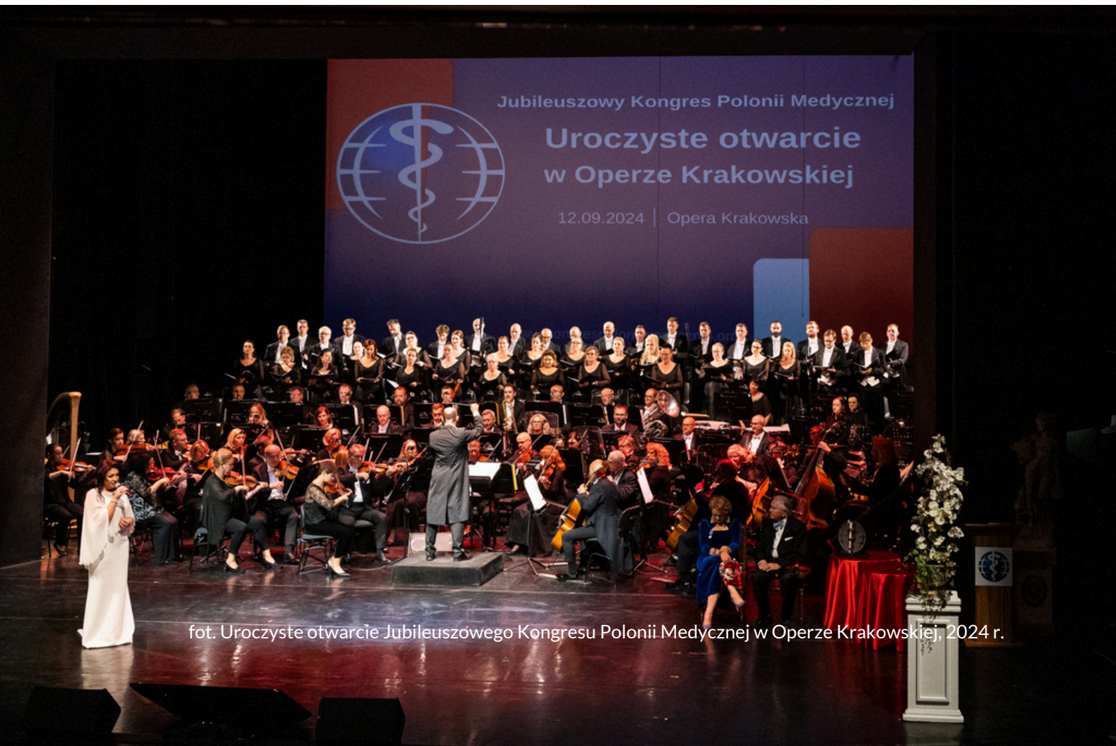
fot. Uroczyste otwarcie Jubileuszowego Kongresu Polonii Medycznej w Operze Krakowskiej, 2024 r.