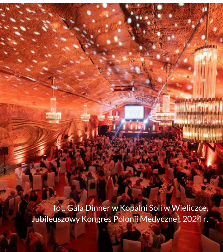
fot. Gala Dinner w Kopalni Soli w Wieliczce, Jubileuszowy Kongres Polonii Medycznej, 2024 r.