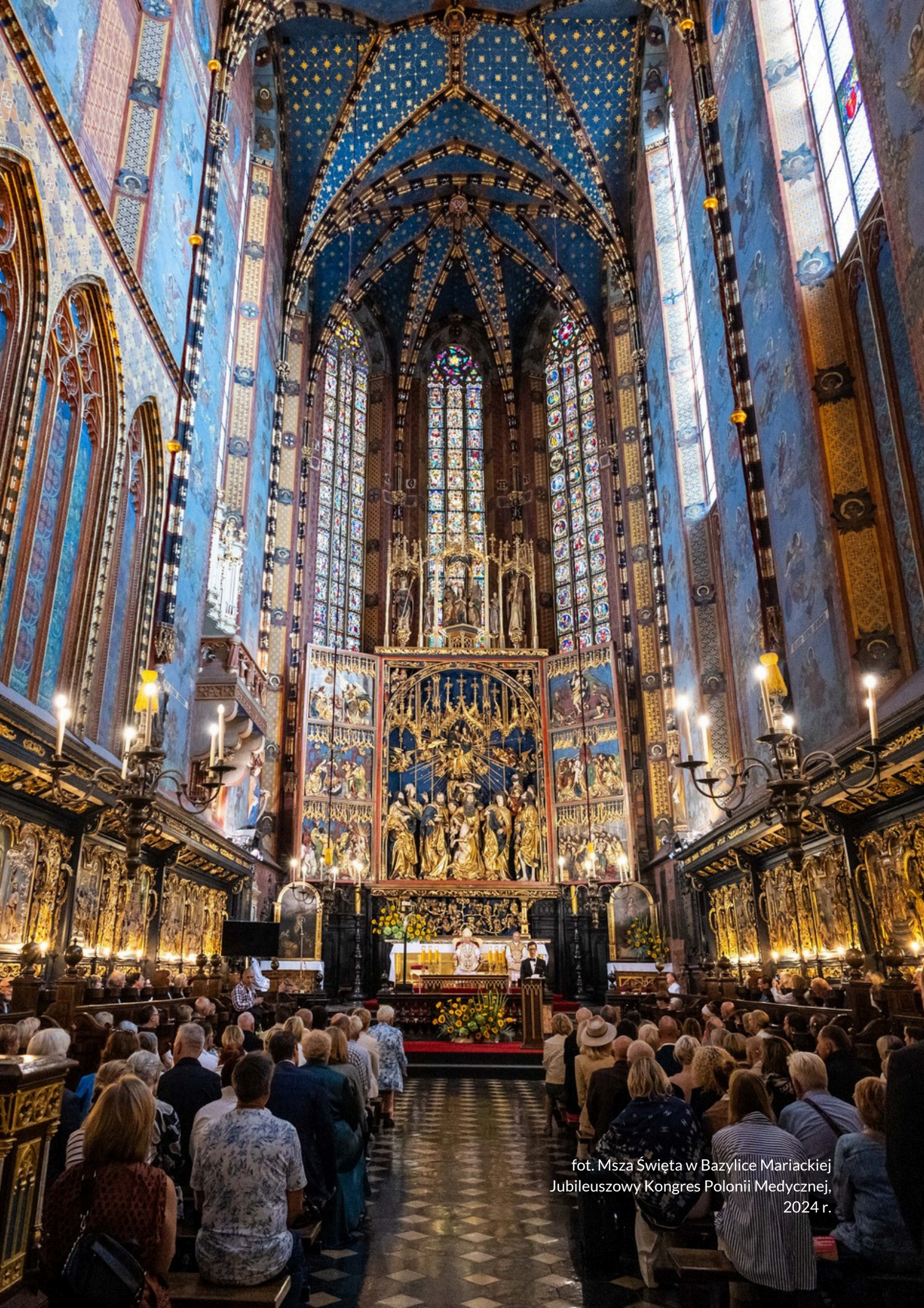
fot. Msza Święta w Bazylice Mariackiej Jubileuszowy Kongres Polonii Medycznej, 2024 r.