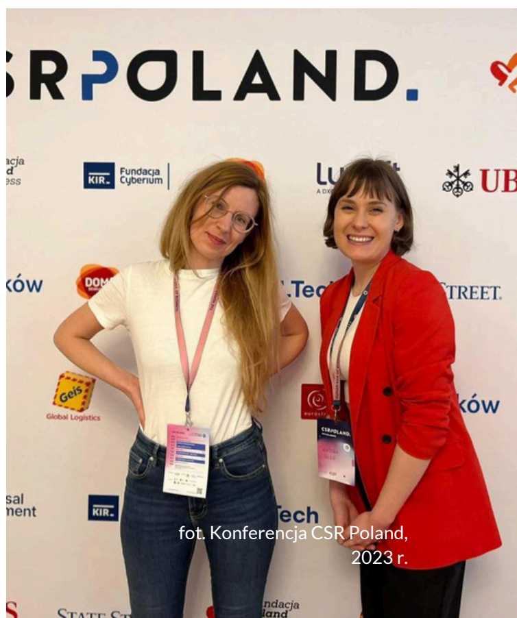
fot. Konferencja CSR Poland, 2023 r.