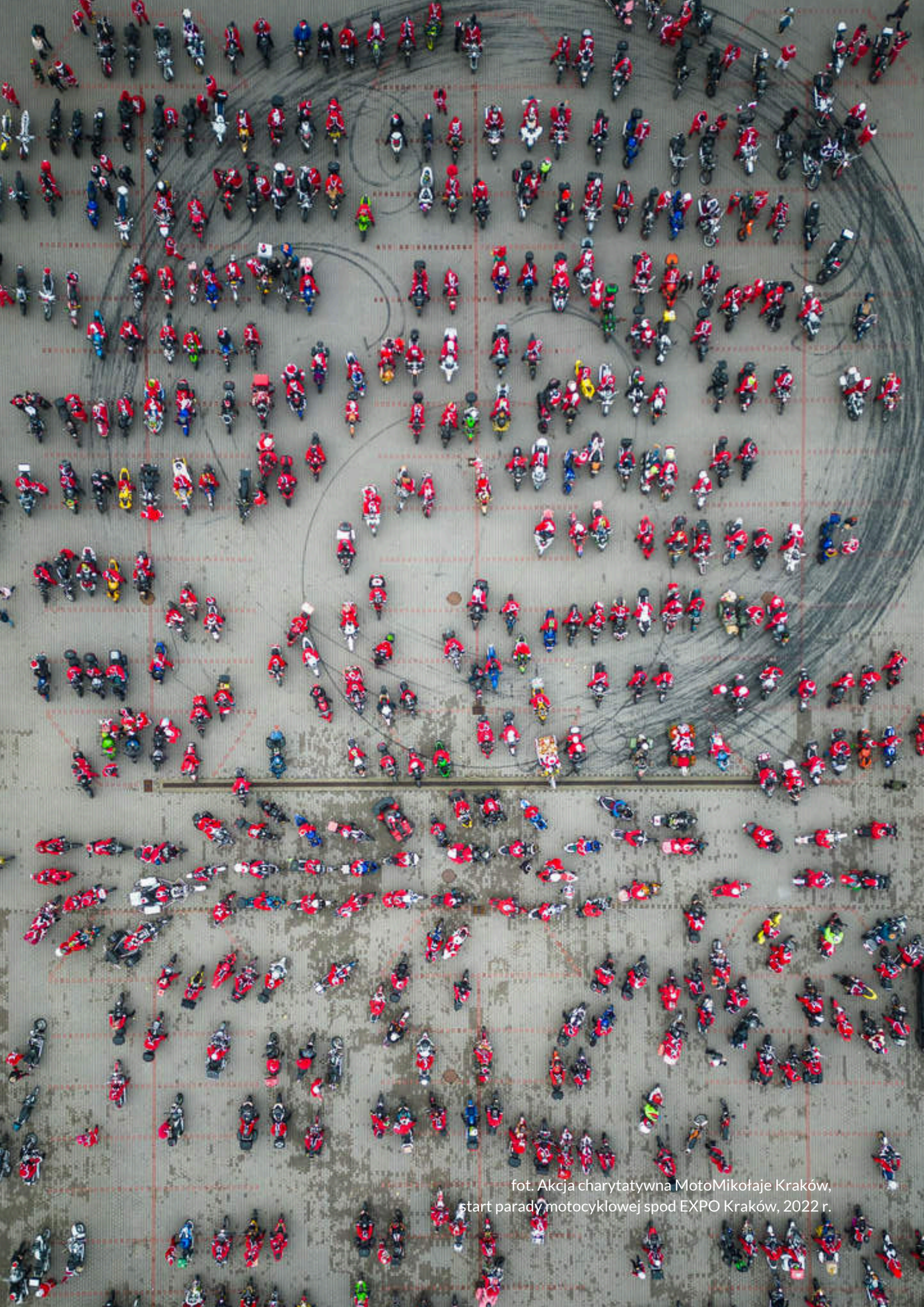
fot. Akcja charytatywna MotoMikołaje Kraków, start parady motocyklowej spod EXPO Kraków, 2022 r.