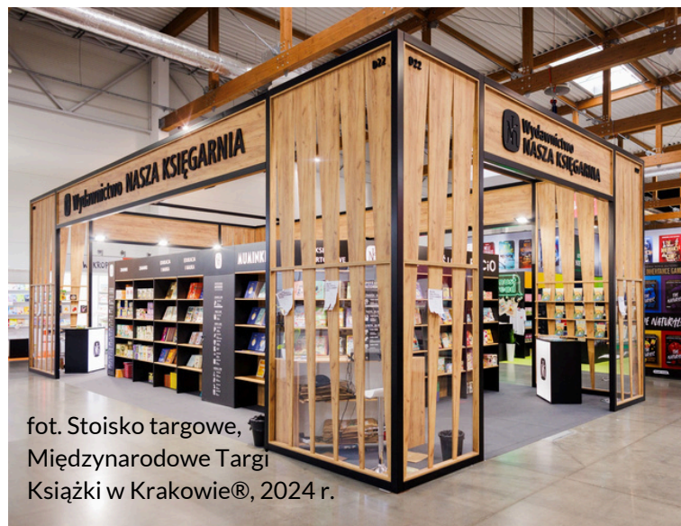
fot. Stoisko targowe, Międzynarodowe Targi Książki w Krakowie®, 2024 r.

Na początku 2025 roku wprowadziliśmy elektroniczny obieg dokumentów, aby zmniejszyć zużycie papieru, ograniczyć emisję CO2 i promować bardziej ekologiczne praktyki, wspierając nasze działania na rzecz zrównoważonego rozwoju.