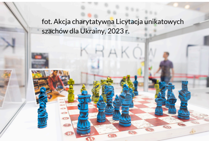
fot. Akcja charytatywna Licytacja unikatowych szachów dla Ukrainy, 2023 r.