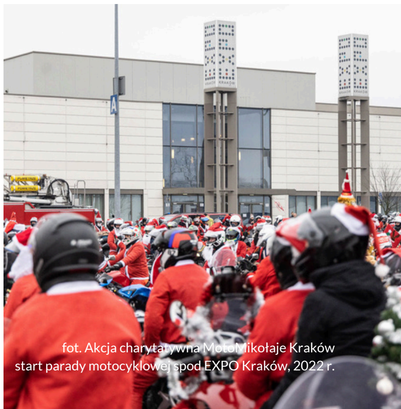
fot. Akcja charytatywna MotoMikołaje Kraków start parady motocyklowej spod EXPO Kraków, 2022 r.

Od 2022 roku Targi w Krakowie wspierają MotoMikołajów ze Stowarzyszenia Motocyklowego „MotoMikołaje Kraków”, którzy w grudniu wyruszają z workami pełnymi prezentów do Uniwersyteckiego Szpitala Dziecięcego i Szpitala Klinicznego im. Babińskiego w Krakowie. Ich misją jest wniesienie radości na oddziały szpitalne. Targi w Krakowie angażują się w akcję na wielu poziomach – udostępniają parking przed EXPO Kraków jako punkt zbiórki setek MotoMikołajów przygotowujących się do widowiskowej parady oraz aktywnie wspierają zbiórkę prezentów dla małych pacjentów szpitali. Do wspólnych działań zapraszają pracowników, partnerów biznesowych, wystawców targów i mieszkańców Krakowa, tworząc przestrzeń do wspólnego działania na rzecz dzieci przebywających w szpitalach.