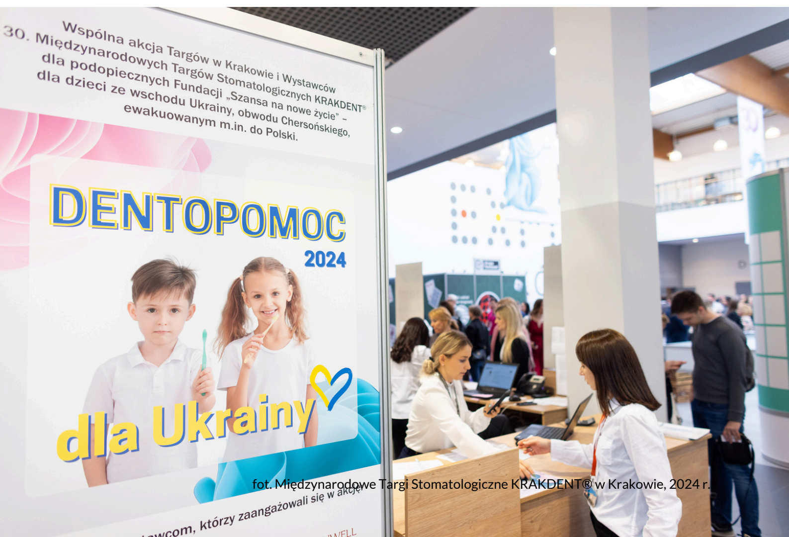
fot. Międzynarodowe Targi Stomatologiczne KRAKDENT® w Krakowie, 2024 r.

jamy ustnej, które trafiają do wychowanków domów dziecka oraz rodzin zastępczych z Małopolski. Po wybuchu wojny w Ukrainie w lutym 2022 roku postanowiliśmy skierować pomoc do potrzebujących Ukraińców. W 2023 roku nawiązaliśmy współpracę z Fundacją „Szansa na nowe życie”, wspierającą dzieci z niepełnosprawnościami ewakuowane z ukraińskich domów dziecka do Polski. Co roku akcja spotyka się z dużym odzewem ze strony firm, które przekazują m.in. produkty do higieny jamy ustnej, żywność, chemię, odzież i różne akcesoria. Wszystkie zebrane produkty trafiają bezpośrednio do podopiecznych Fundacji.