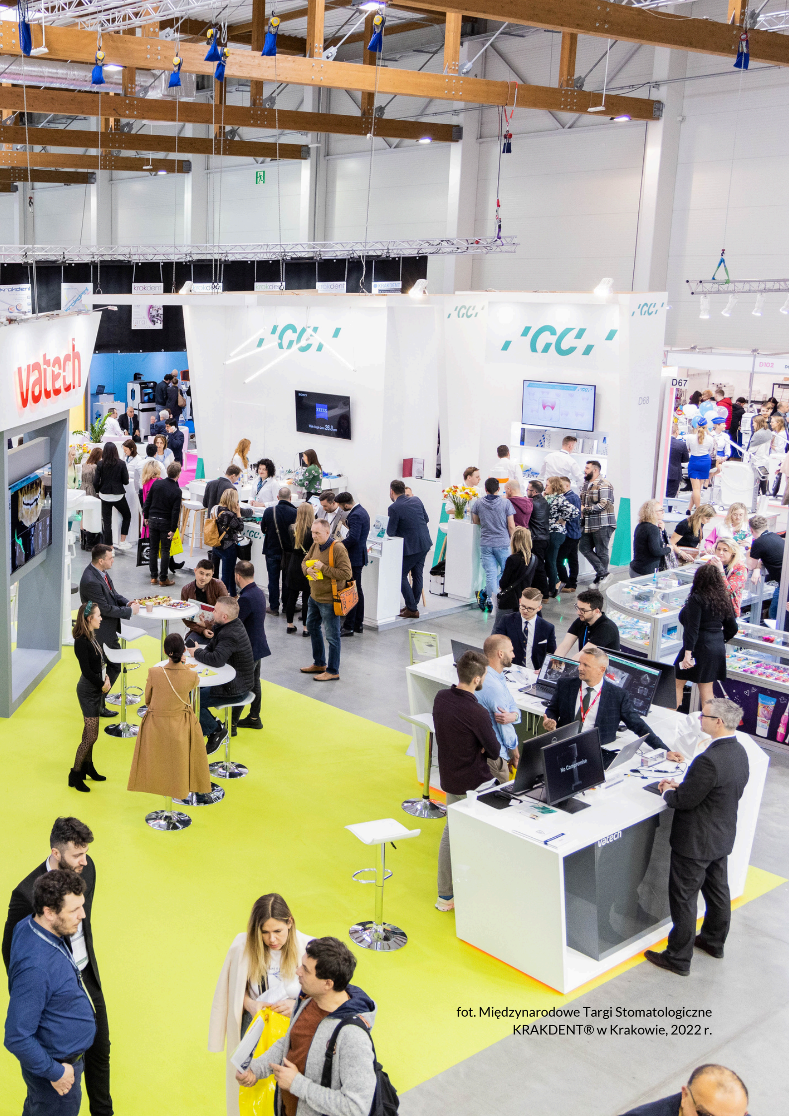
fot. Międzynarodowe Targi Stomatologiczne KRAKIDENT® w Krakowie, 2022 r.