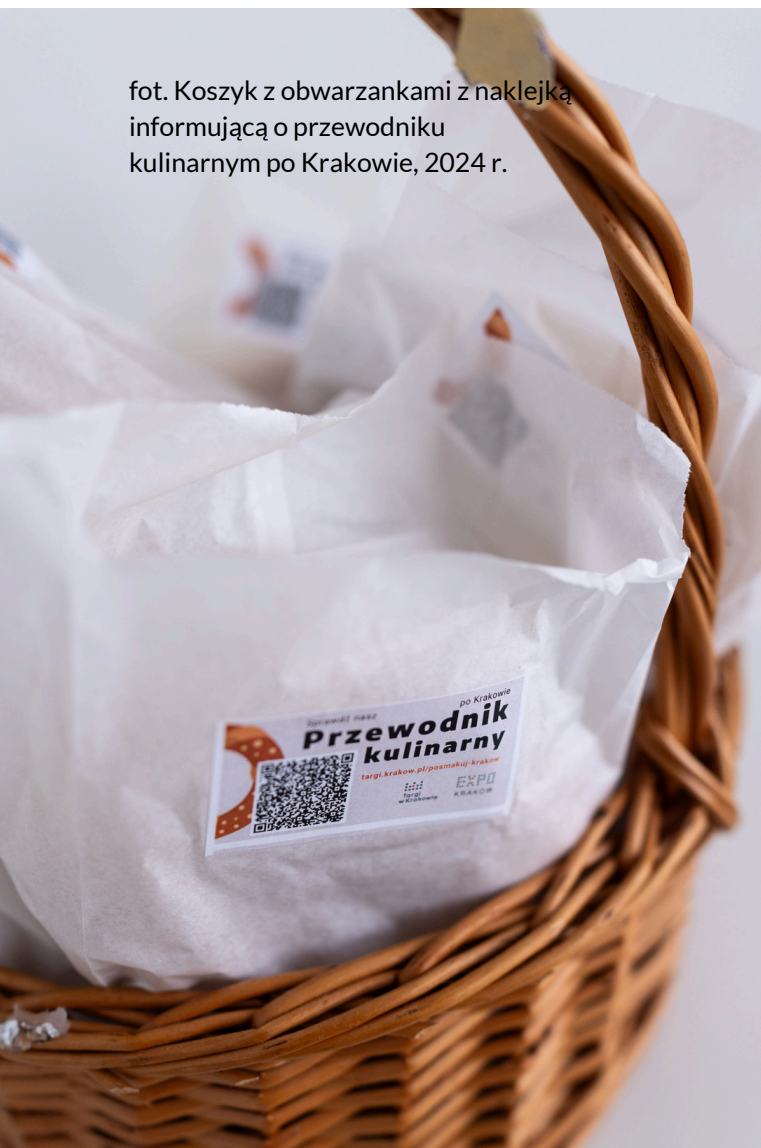
fot. Koszyk z obwarzankami z naklejką informującą o przewodniku kulinarnym po Krakowie, 2024 r.